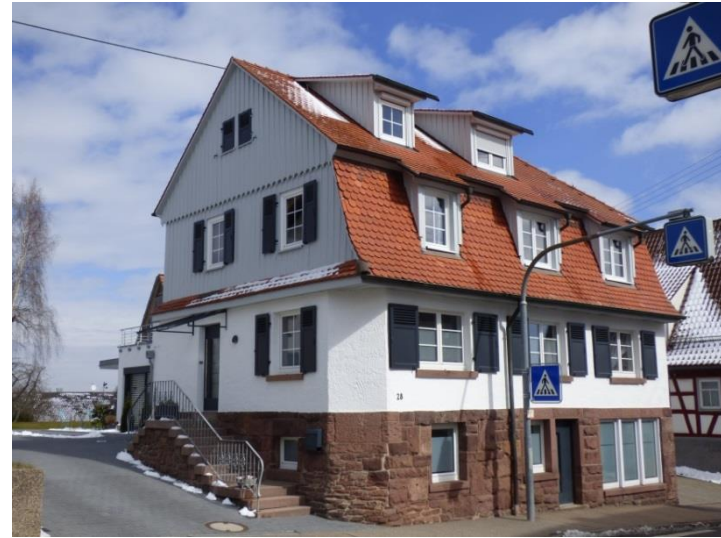
Private Erneuerung mit Teilabbruch anschließendem Anbau