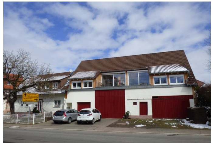
Private Erneuerung mit Wohnraumerweiterung