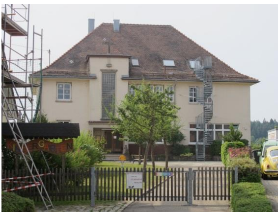
Modernisierung des Kindergartens