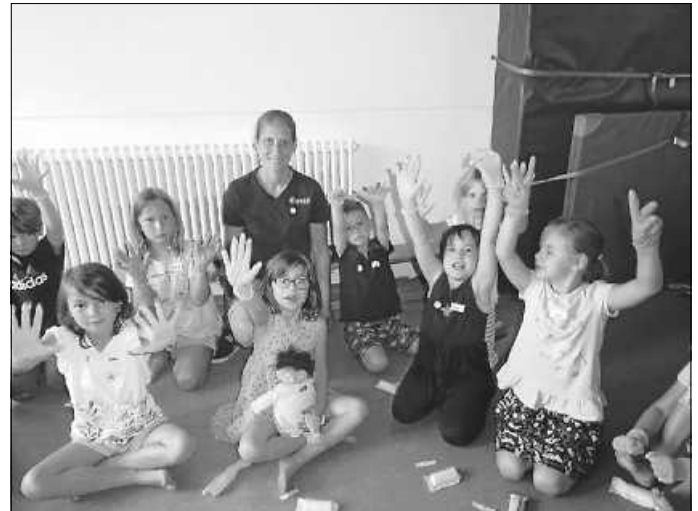
Die Riesen und Erzieherinnen vom Kindergarten Schellbronn