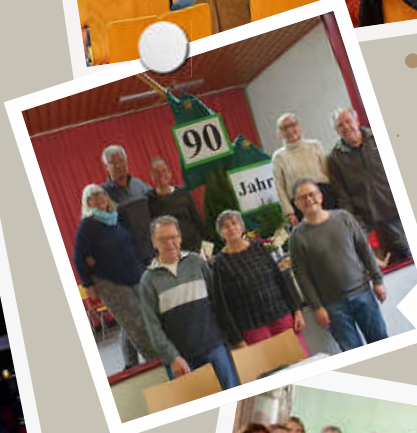
90 JAHRE OGV STEINEGG