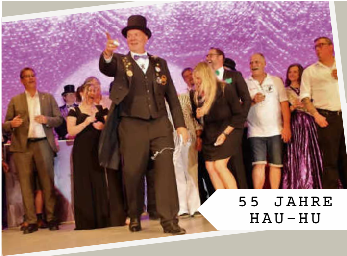
55 JAHRE HAU-HU