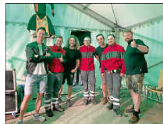
Sanitätsdienst Hau-Hu Jubiläumsumzug