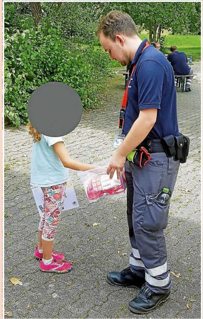
DRK Kinderferientag – Urkunde entgegennehmen