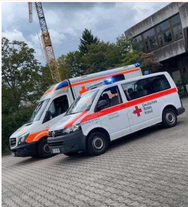
DRK Kinderferientag – Rettungswagen erkunden