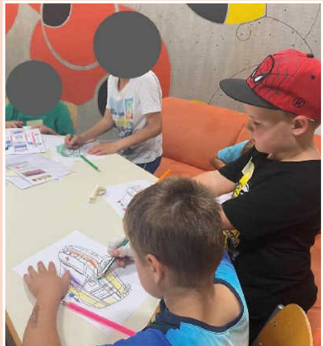
DRK Kinderferientag – malen und basteln