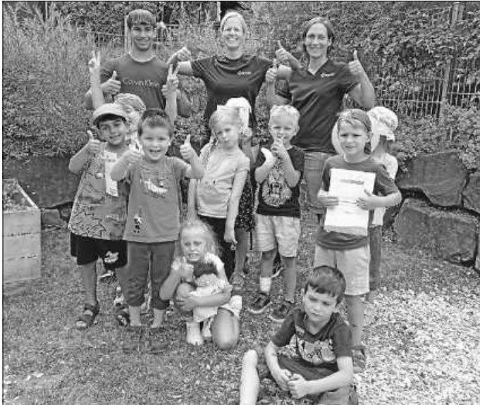
Die Kinder und die ErzieherInnen vom Kindergarten Steinegg

Das war für die Riesen und Wichtel ein interessanter und anschaulicher Vormittag. Deshalb wollen wir uns ganz herzlich beim M-A-U-S Erste Hilfe-Kurs bedanken.