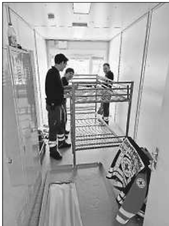
Mithilfe beim Aufbau einer Notunterkunft

Am 14.04.2023 haben vier unserer Helfer und Helferinnen zusammen mit 15 weiteren Helfern anderer Ortsvereine und Einsatzkräften des THW eine neue Notunterkunft für Flüchtlinge in Niefern-Vorort bewohnbar gemacht. Der Einsatzauftrag lautete: Aufbau von ca. 50 Stock- und Einzelbetten in den bereits gestellten Wohncontainern.