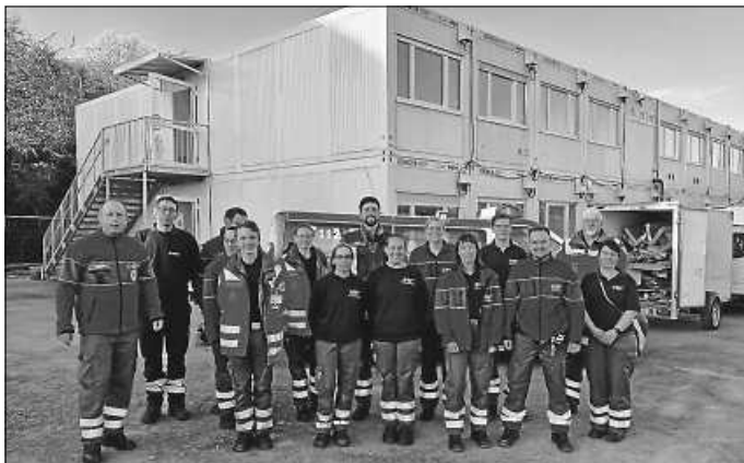
Truppe beim Aufbau der Notunterkunft

Das Engagement der Helfer des DRK Neuhausen bei Einsätzen und Übungen der Einsatzeinheit 4 Pforzheim-Enzkreis stellt eine wichtige Stütze im Bevölkerungs- und Katastrophenschutz in unserer Region dar. Wir unterstützen insbesondere in den Bereichen Führung und Sanitätsdienst, aber natürlich auch überall dort wo Hilfe benötigt wird. So konnte auch in diesem Einsatz die Einsatzleitung durch einen unserer neu ausgebildeten Gruppenführer gestellt werden.