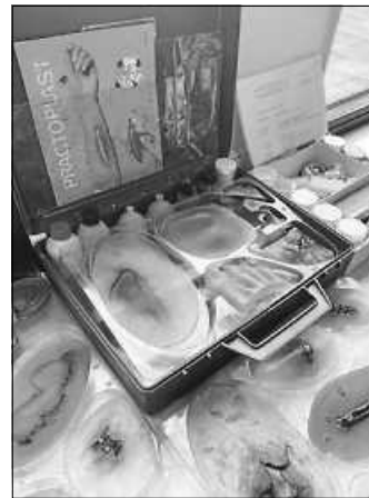
Ältere Requisiten aus der Notfalldarstellung/Unfalldarstellung

Kaltschweißigkeit geübt. Gleichzeitig bekamen wir dann aber auch die Aufgabe uns in den Patienten hineinzusetzen und dabei unser schauspielerisches Talent zu zeigen.