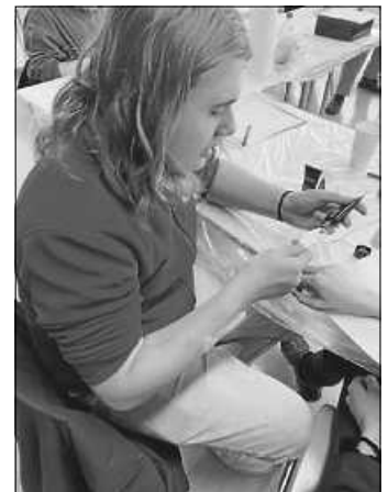
Jugendrotkreuzler beim Modellieren und Schminken eines Bruches

Nach dem Lehrgang ist es jetzt unser Ziel, uns in diesem Bereich weiter fortzubilden und zu üben, sodass wir zukünftig bei Übungsabenden, (Groß-)Übungen und Ausbildungen mit am Start sein können, um diese möglichst realistisch mitzugestalten.