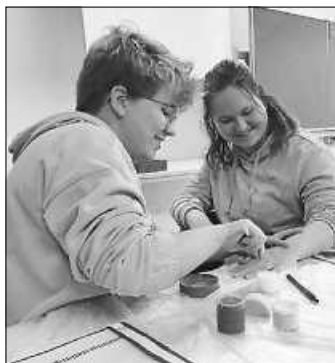
Jugendrotkreuzler beim Schminken einer Wunde

Au weia! Was ist denn hier passiert? Ein Angriff eines wilden Tieres? Ein Arbeitsunfall beim Schneiden eines Dornenbusches? Nein, keine Sorge! Es ist niemand verletzt, denn die Wunde ist nicht echt. Das Jugendrotkreuz Neuhausen war am 04. und 05.03.2023 in Pforzheim beim Grundlehrgang Notfalldarstellung. Acht Mitglieder aus Neuhausen hatten sich gemeldet, um an diesen zwei Tagen die Grundlagen des Schminkens von Wunden und das Darstellen von Notfällen zu erlernen. Neben kleineren Riss- und Schnittwunden, wurden auch noch einige andere Sachen, wie das Schminken von Knochenbrüchen sowie Blässe mit