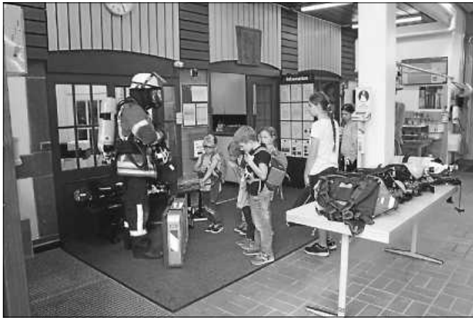
Ein Feuerwehrmann voll ausgerüstet!