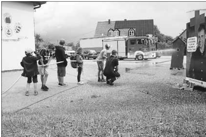
Die Kinder bei einer Löschübung