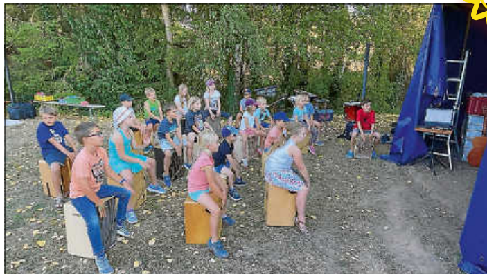
Auftritt beim Sandmann