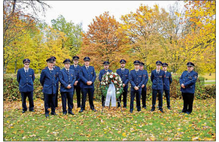
Kranzniederlegung am Friedhof Steinegg

Aus diesem Anlass legen wir zur Ehrung unserer verstorbenen Kameraden gemeinsam einen Kranz nieder und gedenken ihrem Vermächtnis.