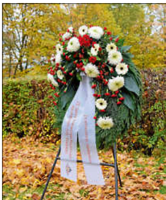
Kranz zur Ehrung der verstorbenen Kameraden

Das 75-jährige Jubiläum der FFW Abteilung Steinegg starten wir mit dem Gedenken an unsere verstorbenen Kameraden.