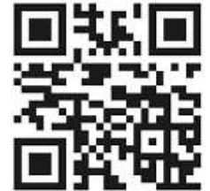
Grafik: S. Nofert-Steigert

Sie können uns auch gerne eine E-Mail schreiben. Von persönlichen Besuchen bitten wir abzusehen. Falls Sie aber doch zwingend im Pfarrbüro vorbeikommen müssen, vereinbaren Sie bitte vorher telefonisch einen Termin.