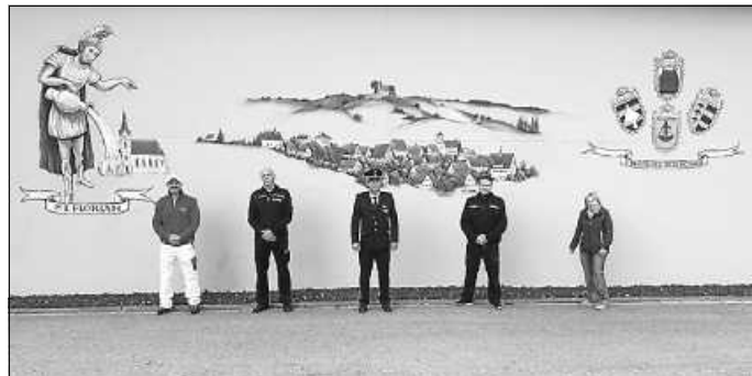
Das Werk mit den Beteiligten

Was für ein Unterschied – sattes Grün auf dem Hügel der Sankt Wendelinus Kapelle zwischen Steinegg und Neuhausen, darunter eingebettet das Dorf Neuhausen, genauso, wie es Hans Howad 1975 zur Einweihung des Feuerwehrhauses gemalt hatte.