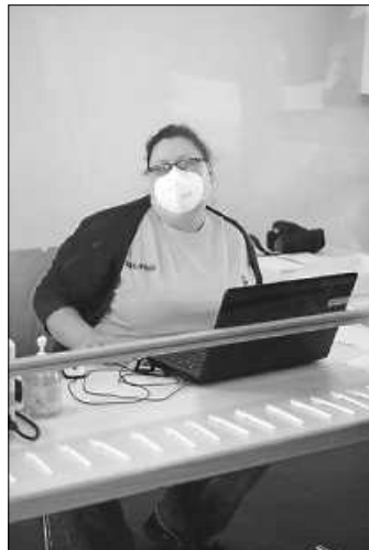
Testzentrum Schellbronn