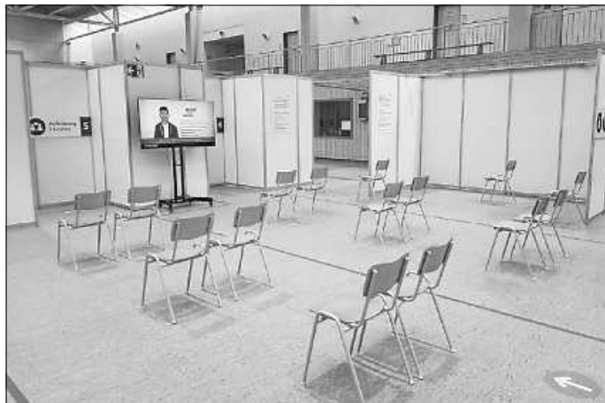
Impfzentrum Enzkreis

Die Zusammenarbeit mit Ärzt*innen, medizinischem Fachpersonal, den Sicherheitsdiensten, der Bundeswehr und anderen Hilfsorganisationen vor Ort funktioniert bestens und auch die Rückmeldungen der Geimpften sind durchweg positiv. Hierfür bedanken wir uns herzlich. Selbstverständlich werden wir die Impfungen auch weiterhin tatkräftig unterstützen, so lange unsere Hilfe benötigt wird. Anbei ein paar Impressionen aus unseren Diensten.