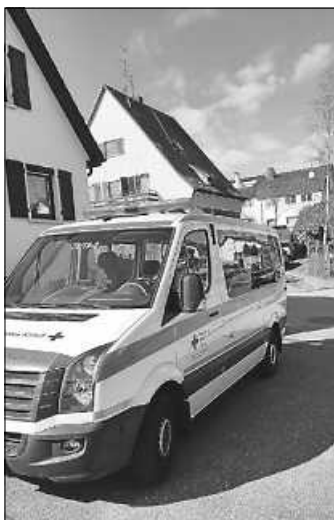
Impfzentrum Enzkreis

Seitdem die Impfzentren im Januar starteten, sind wir Rotkreuzler aus Neuhausen mit von der Partie. Wir haben Schichten im Sanitätsdienst übernommen, oder als Helfer bei den dort startenden mobilen Impfungen, z.B. in Altenheimen oder Pflegeeinrichtungen. Auf Grund der örtlichen Nähe entfiel der Großteil der Dienste auf das Kreisimpfzentrum Mönsheim. Aber auch im Impfzentrum der Stadt Pforzheim und vor kurzem bei der Erprobung eines sogenannten „Pop-up Impfzentrums“ waren wir aktiv. Dabei handelt es sich um zeitlich begrenzte Vor-Ort-Impfungen, die in einer geeigneten Lokalität eingerichtet werden und die bestehende