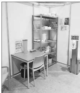
Impfzentrum Enzkreis

Die Zusammenarbeit mit Ärzt*innen, medizinischem Fachpersonal, den Sicherheitsdiensten, der Bundeswehr und anderen Hilfsorganisationen vor Ort funktioniert bestens und auch die Rückmeldungen der Geimpften sind durchweg positiv. Hierfür bedanken wir uns herzlich. Selbstverständlich werden wir die Impfungen auch weiterhin tatkräftig unterstützen, so lange unsere Hilfe benötigt wird. Anbei ein paar Impressionen aus unseren Diensten.