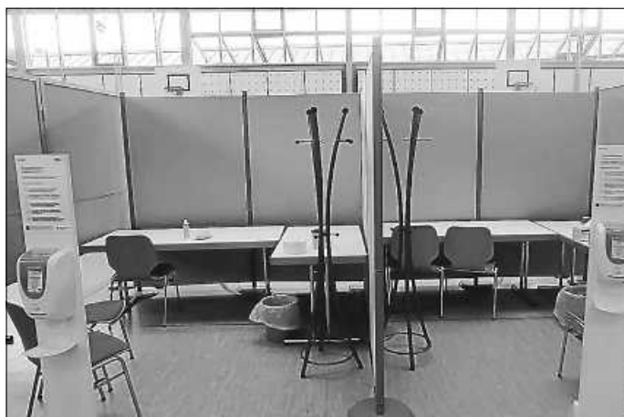
Impfzentrum Enzkreis