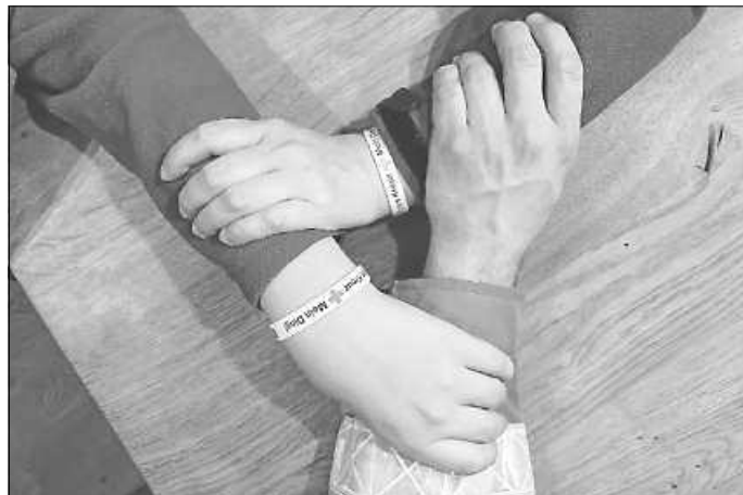
Zusammen sind wir stark

Ihr Team des Deutschen Roten Kreuzes Neuhausen