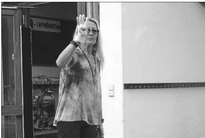
Der Riese im Farbenland

Endlich, am 16.09.2020, war es dann soweit. Sie durfte uns zu einer kleinen Abschiedsfeier im Freien und mit dem nötigen Abstand besuchen kommen.