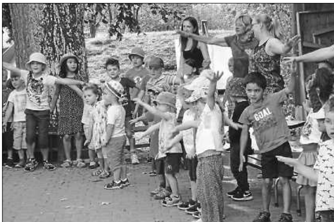
So a schöner Tag (Fliegerlied)